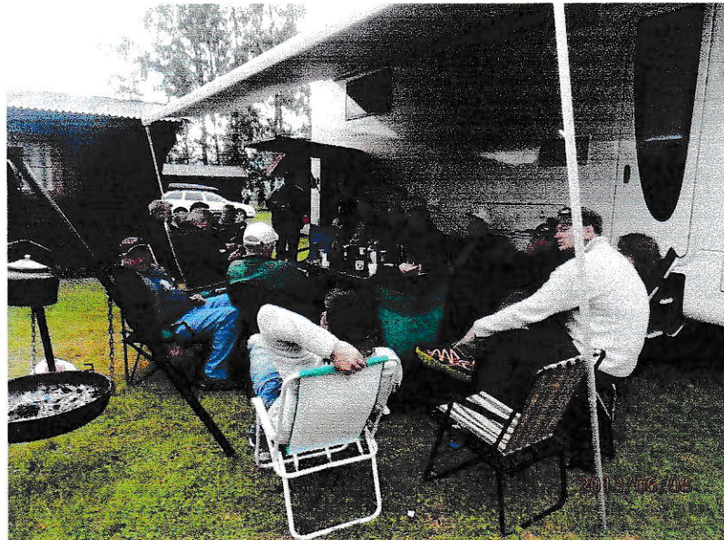
Svartkjel og Trønderbataljonen under vingen på Concorden