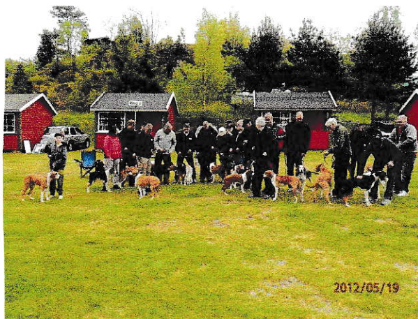
Alle fremviste hygenhunder