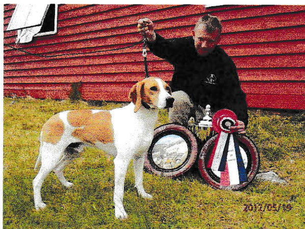
Pondus av Holmerud